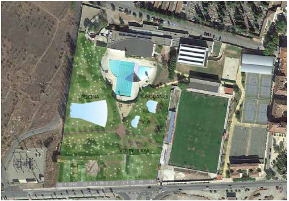
Nueva piscina con toboganes, zonas verdes y aparcamiento en el C.D.M "La Planilla".