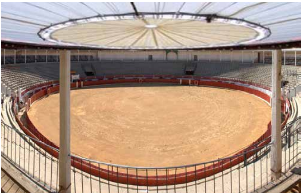
Cubrición de la plaza de toros para celebrar espectáculos y festivales.